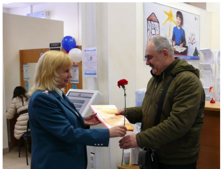
Пресс-служба УФНС России по Орловской области